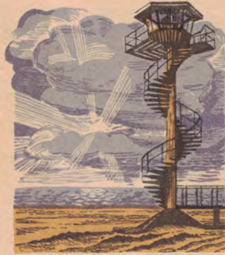
Латвийская ССР. Вентспилс. Наблюдательная вышка на пляже. Latvijas PSR. Ventspils. Novērošanas tornis pludmalē.