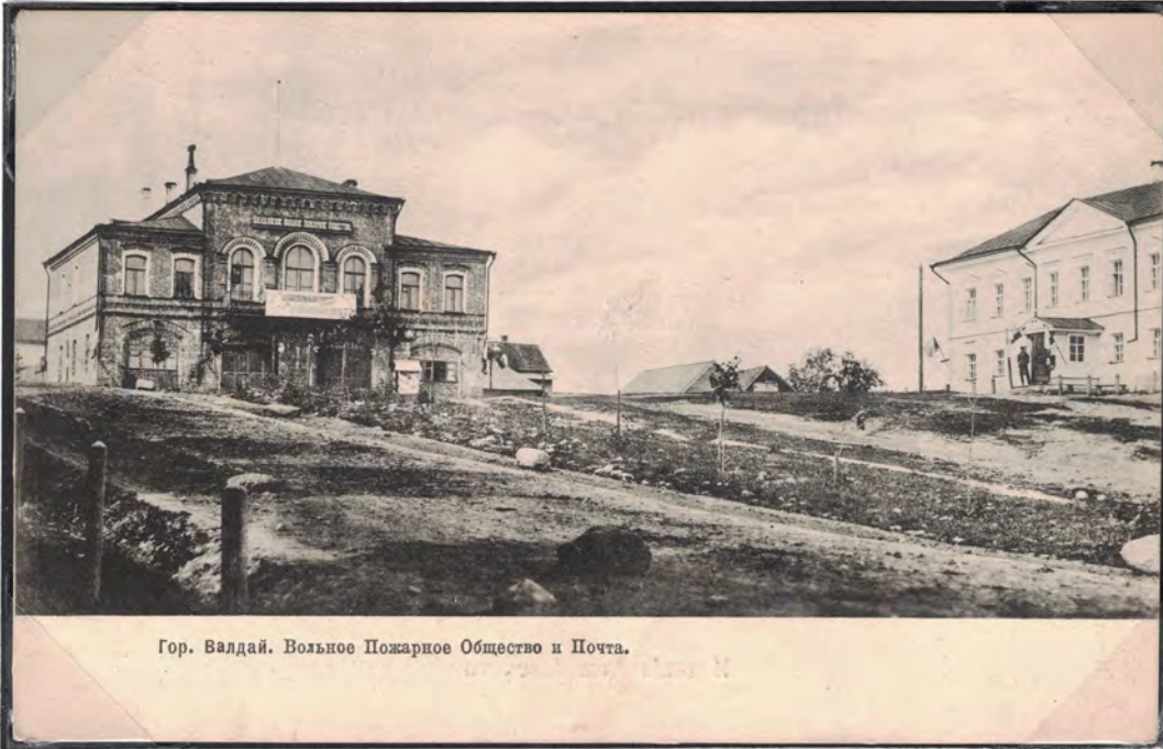
Гор. Валдай. Вольное Пожарное Общество и Почта.